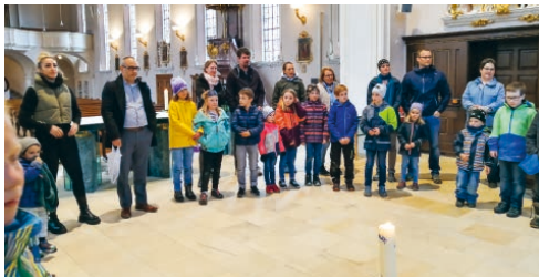
Die Kinder auf dem Versöhnungsweg.

Erstkommunion Degersheim-Wolfertswil Sonntag, 1. Mai, 10.15 Uhr, Kirche anschliessend sind Sie ganz herzlich zum Apéro eingeladen.