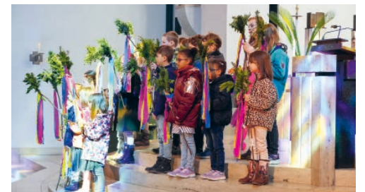
Auftritt der Kinder der Sunntigsfir