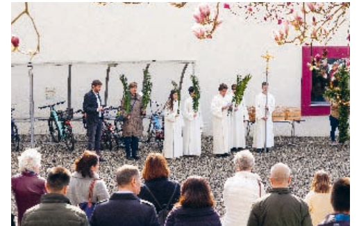
Ministrant*innen und Lektor*innen