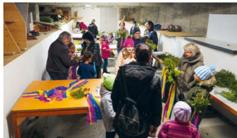
Palmzweige binden mit den Sunntigsfir-Familien