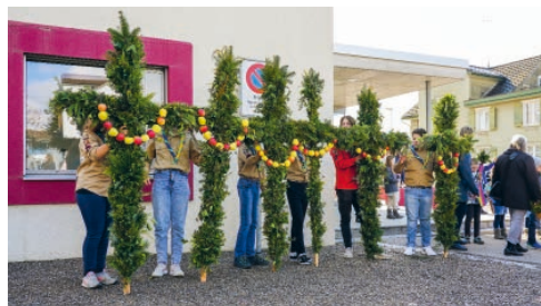
Palmenkreuze von Pfadi und Blauring