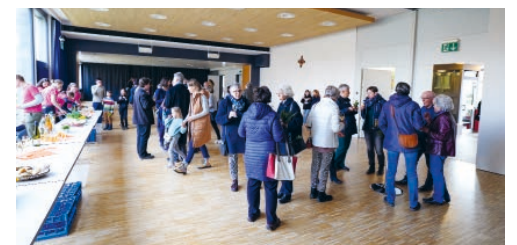
Pfarreiapéro organisiert durch das Team Gemeinschaft mit Unterstützung der Oberministrant*innen