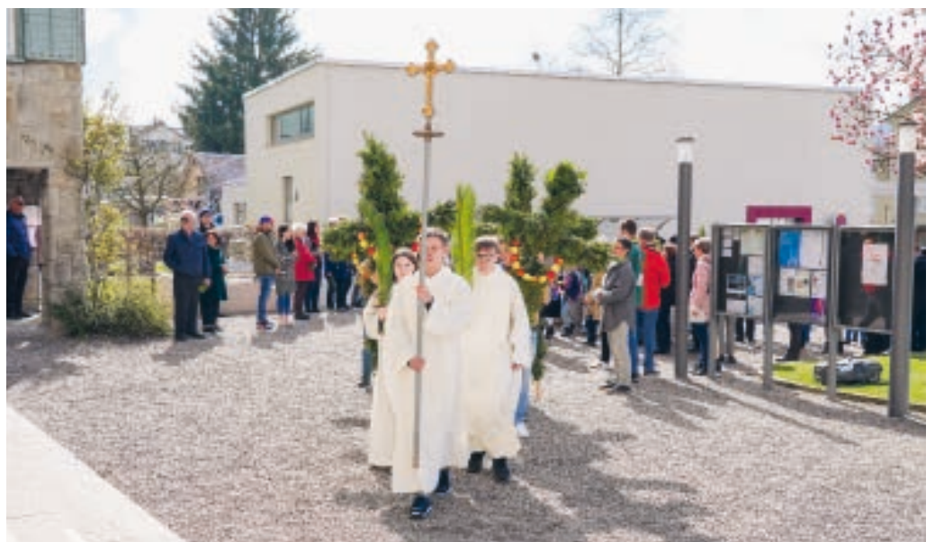
Einzug in die Kirche